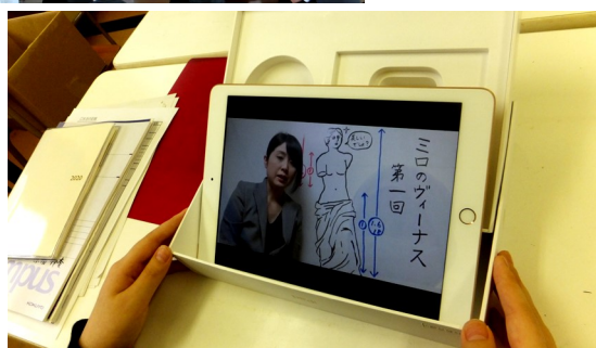
(2学年現代文の動画を用いての講義)

クラウドサービスにより、学校のICT化を多角的にサポートする教育プラットフォームを本年度より導入し、生徒個々の理解度に応じた学習機会を提供しています。またオンラインで、生徒や保護者に案内や資料等を送ることにより、情報のペーパーレス化を図るとともに、情報発信や資料共有を確実なものとしています。